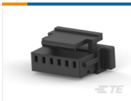
TE 产品编号2367198-6 1.0 WTB HOUSING WITH LATCH