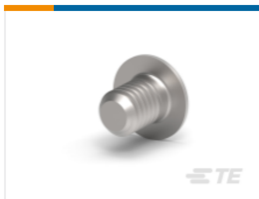
TE 产品编号1410946-3 MULTI-GIG SOC. CAP SCREW, CUSTOMIZED HDW