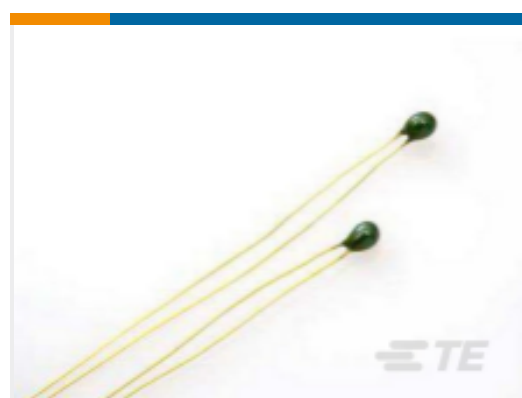
TE 产品编号11026436-00 55016 GEM THERM