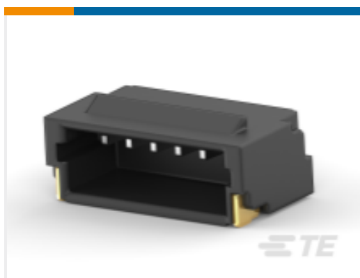
TE 产品编号2367196-6 1.0mm WTB RIGHT ANGLE TYPE WITH LATCH