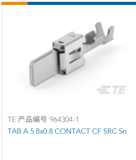
TE 产品编号 964304-1 TAB A 5.8x0.8 CONTACT CF SRC Sn