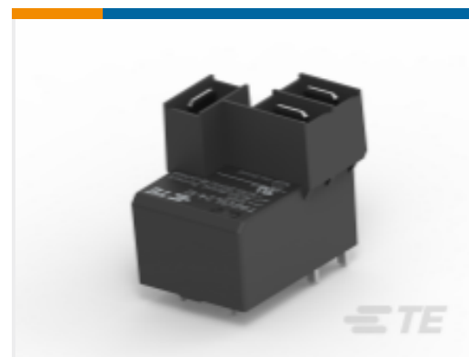
TE 产品编号1558676-6 T9GS1L24-22