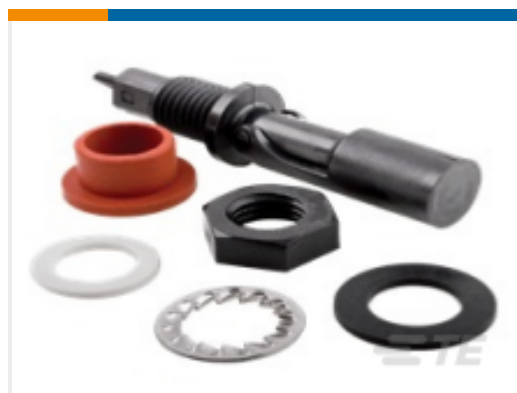
TE 产品编号80645-000 LS809-51 Liquid Level Sensor