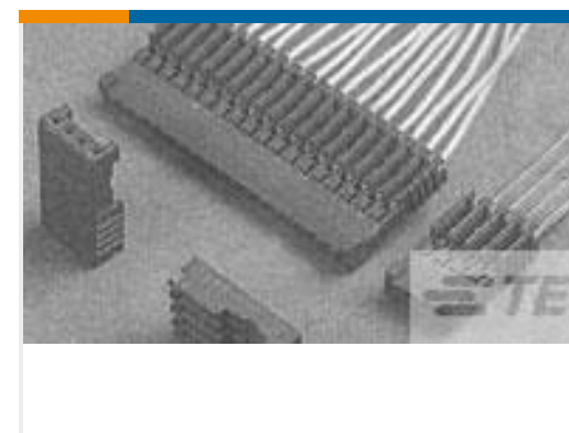
TE 产品编号1-281786-2 PLUG HE14 IDC 180 12 P AWG 28-26