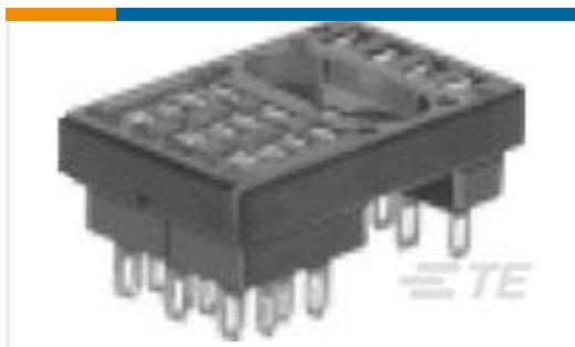
TE 产品编号 1-1393143-0 27E127=SOCKET,R10,22,SLG,PHE