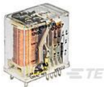
TE 产品编号 9-1393768-8 R10-R2W2-V700=R10