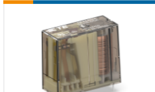
TE 产品编号7-1415546-8 RP824024