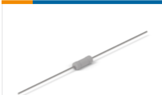
TE 产品编号1-1676123-0 1/2W SM M/OX 5% 2R0