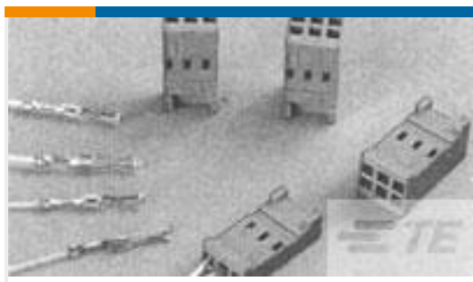
TE 产品编号281839-4 HOUSING HE13 HE14 COSI 2X4 P