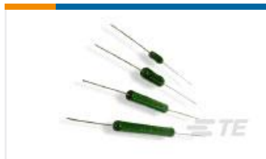
TE 产品编号3-1623773-0 C10 68R 5% (LOOSE)