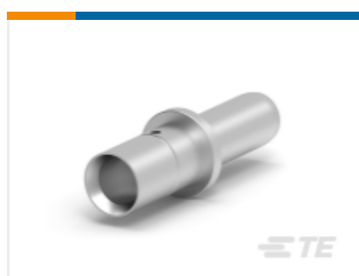
TE 产品编号SRK-PC-080-25-601 PIN, SOLID, SIZE M8, 25mm2, AG