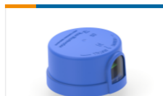
TE 产品编号L2134Z-000 ALR-7090-VPS