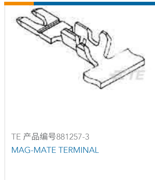
TE 产品编号881257-3 MAG-MATE TERMINAL