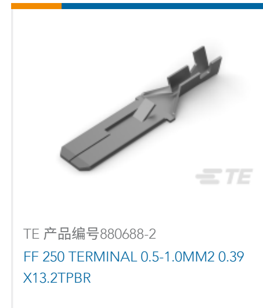
TE 产品编号880688-2 FF 250 TERMINAL 0.5-1.0MM2 0.39 X13.2TPBR