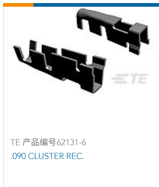
TE 产品编号62131-6 .090 CLUSTER REC.