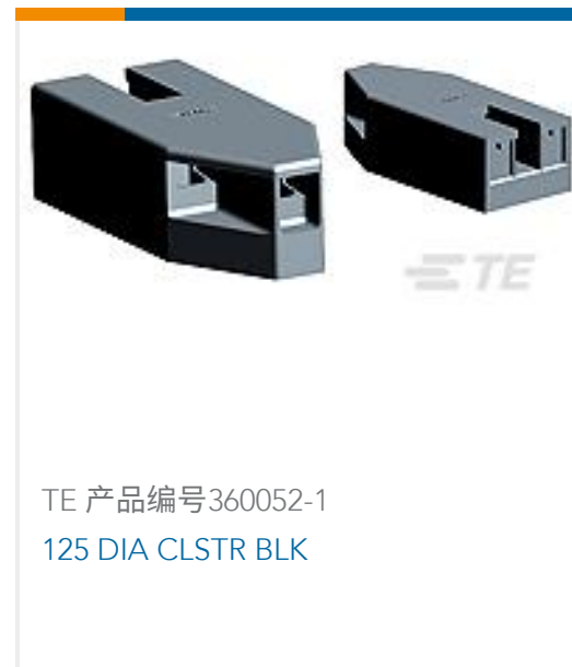
TE 产品编号360052-1 125 DIA CLSTR BLK