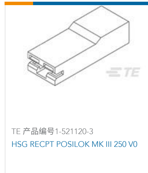
TE 产品编号1-521120-3 HSG RECPT POSILOK MK III 250 V0