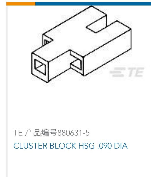
TE 产品编号880631-5 CLUSTER BLOCK HSG .090 DIA