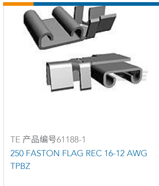
TE 产品编号61188-1 250 FASTON FLAG REC 16-12 AWG TPBZ