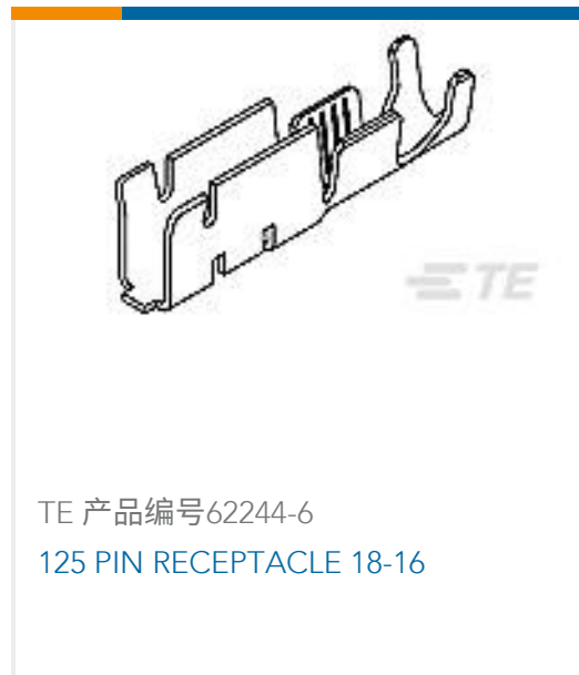
TE 产品编号62244-6 125 PIN RECEPTACLE 18-16