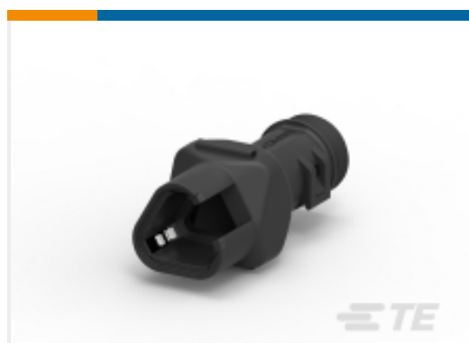
TE 产品编号1011-231-0305 BKSHL, 3P, BLK, PLG, ST, NW6/7.5/8.5 /10