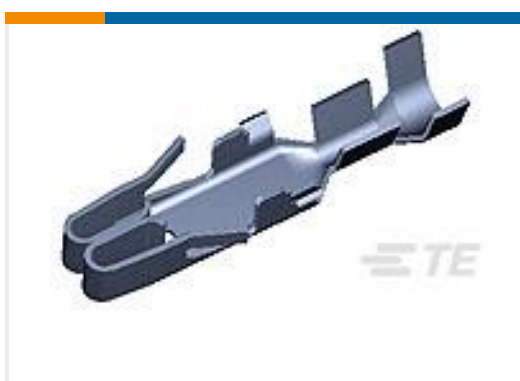
TE 产品编号880397-2 FUSE CONTACT