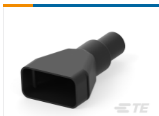
TE 产品编号DRC26-50BT BOOT, 50P, 20SZ, PLG/REC, ST, BLK