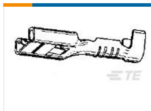
TE 产品编号735222-2 FF 250 REC 1.0-2.5 MM2 0.32X 19.30 BR