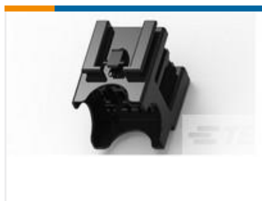
TE 产品编号1801618-1 RELAY 40A HOLDER