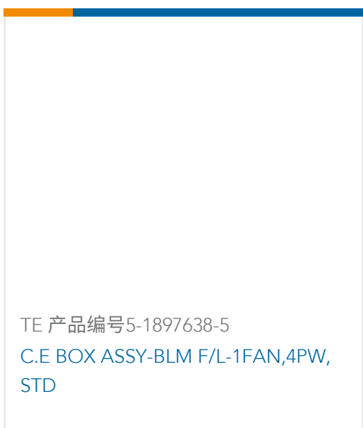
TE 产品编号5-1897638-5 C.E BOX ASSY-BLM F/L-1FAN,4PW, STD