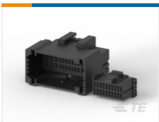
TE 产品编号936133-2 MULTILOCK, 连接器壳体