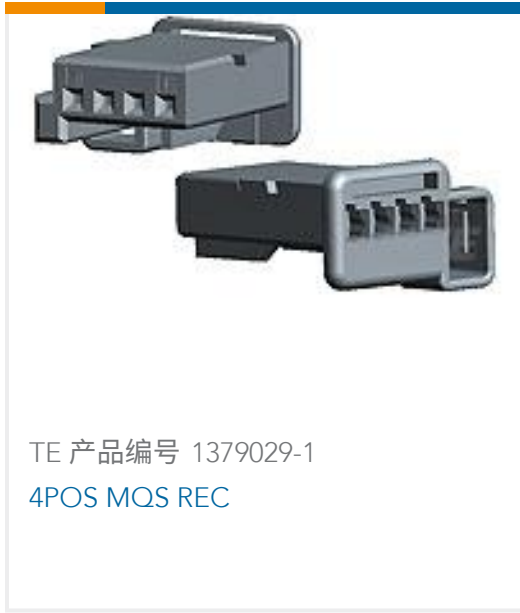
TE 产品编号 1379029-1 4POS MQS REC