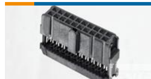
TE 产品编号1658622-4 20 NOVO MIL/CTR 30DP,LEAD FREE