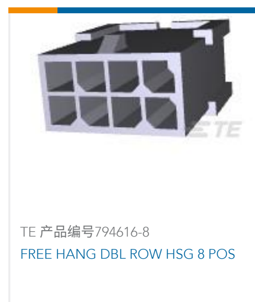
TE 产品编号794616-8 FREE HANG DBL ROW HSG 8 POS