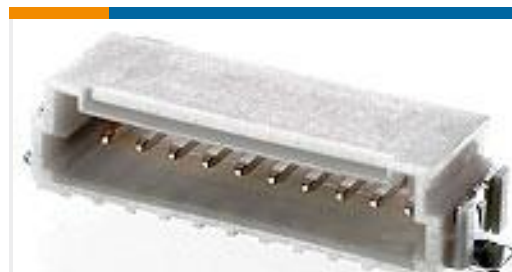
TE 产品编号292228-2 1.5 MINI CT SGL H SMT W/O BOSS