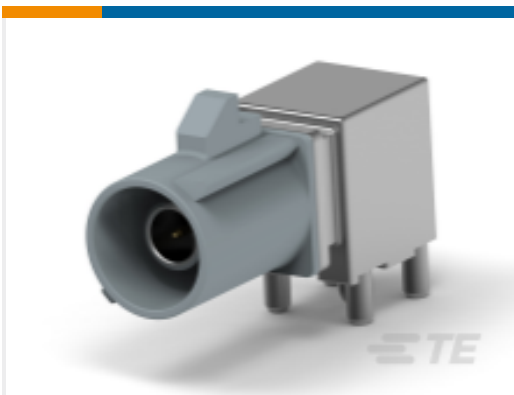
TE 产品编号2291392-7 MALE ASM, 1 POS, R/A, PCB, FAKRA