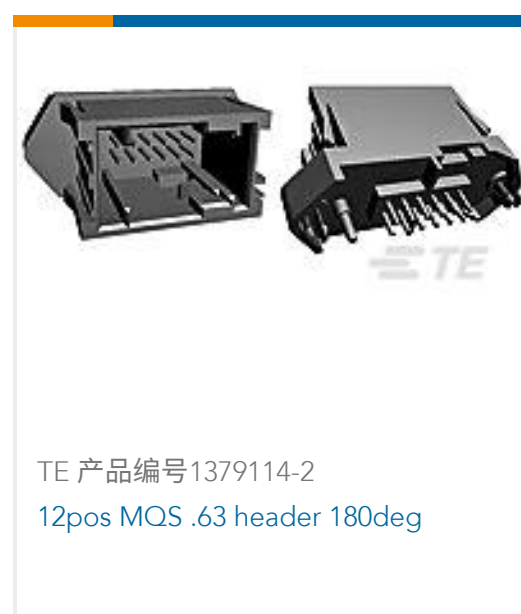
TE 产品编号1379114-2 12pos MQS .63 header 180deg