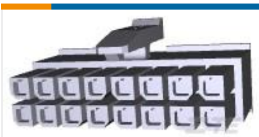
TE 产品编号1-794617-6 16POS,MICRO MNL,RCPT HSG