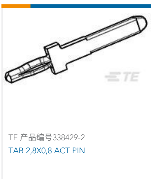
TE 产品编号338429-2 TAB 2,8X0,8 ACT PIN