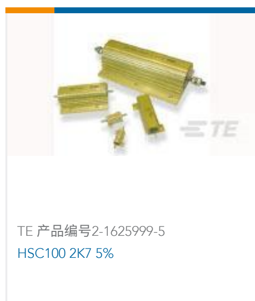
TE 产品编号2-1625999-5 HSC100 2K7 5%