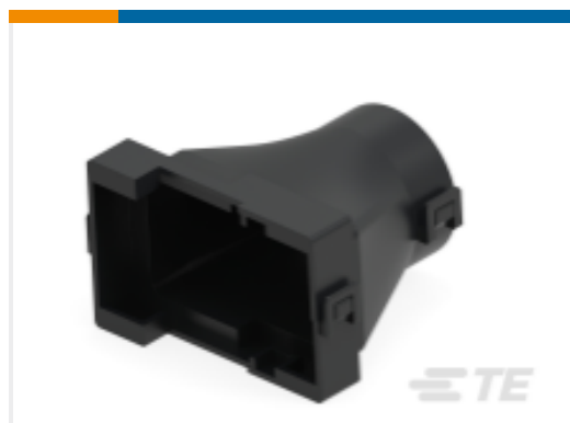
TE 产品编号936614-2 HYBRID 42P CAP COVER HSG