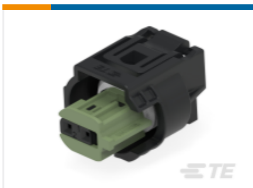
TE 产品编号2373835-1 2POS, MQS, REC HSG ASSY, SLD, COD A