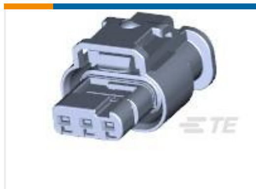
TE 产品编号1488991-5 3POS, MCON 1.2 CB REC 2p TL SEALED