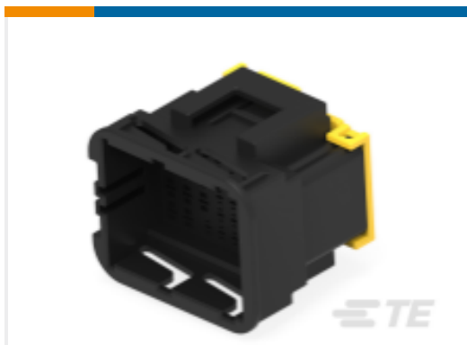
TE 产品编号936429-2 HYBRID 42P CAP ASSY BLK