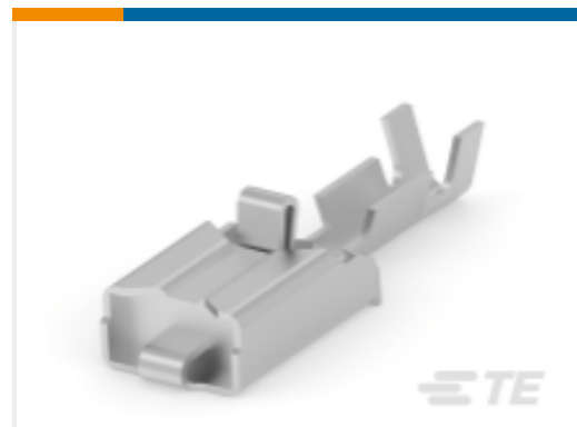
TE 产品编号2196069-2 250 SER RCPT TERM SMALL TIN PLATED