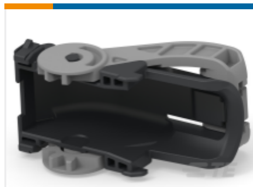
TE 产品编号2174114-1 WIRE COVER ASSEMBLY 50POS 0.5/1. 0 SEALED