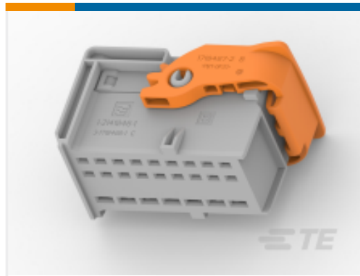
TE 产品编号1-2141846-2 CARRIER,RECEPTACLE HSG, 25POS, ASSY