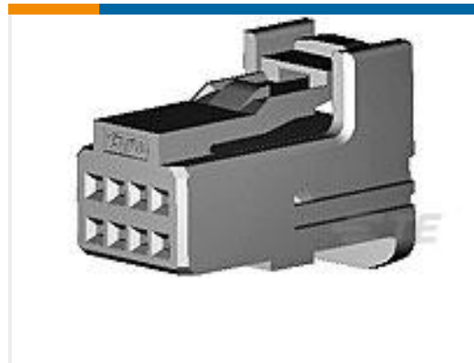
TE 产品编号1379662-1 12W PLUG HSG ASSY BLACK