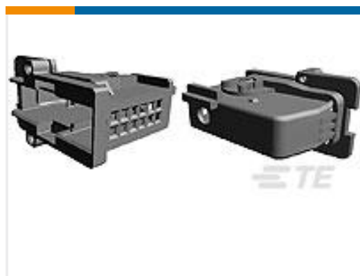
TE 产品编号1379095-2 COV+LEV MQS 12W 0DEG BLUE