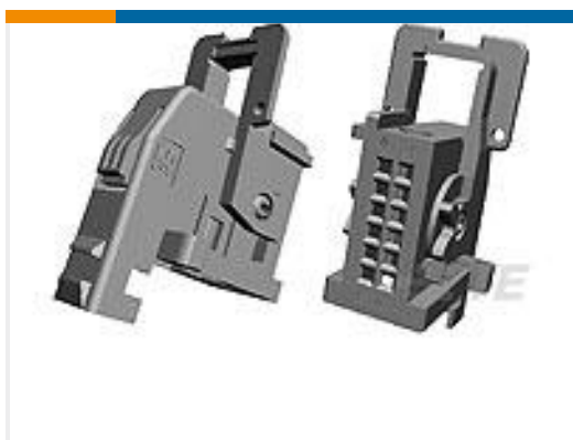
TE 产品编号1379096-2 COV+LEV MQS 12W 90DEG BLU