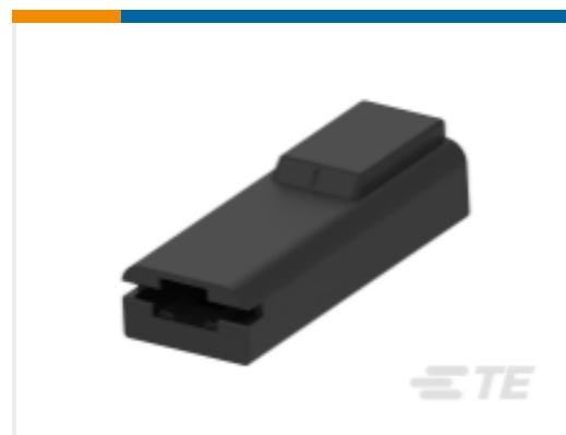
TE 产品编号1-1544408-3 CAP. POLYAMID 6.3