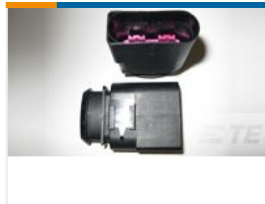
TE 产品编号1534159-1 TAB HOUSING 2.8 4P,RD