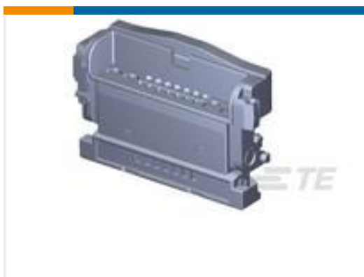
TE 产品编号1801735-1 18W HYBRID UNSEALED RCPT HSG ASSY BLACK