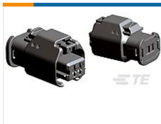
TE 产品编号1801175-1 2W RECEPTACLE HP CONNECTOR BLACK