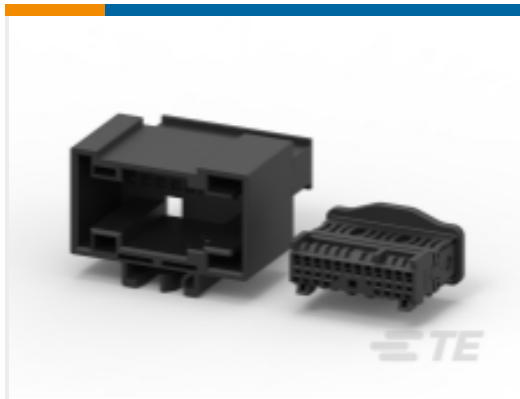
TE 产品编号1379102-1 MQS 连接器外壳