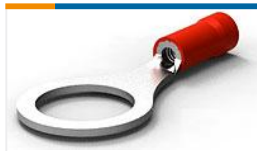
TE 产品编号34152 PG R 22-16 COMM 22-18 MIL 3/8