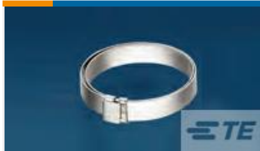
TE 产品编号CW2822-000 R85049/128-1