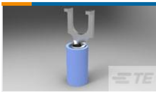
TE 产品编号8-320863-1 TERMINAL,PIDG SPD FLG 16-14 10