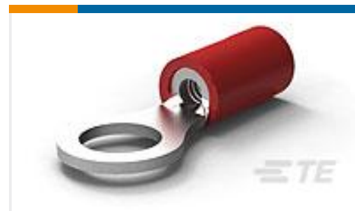
TE 产品编号130014 TERM, R, PG, 22-16, M5