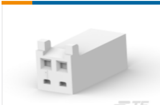
TE 产品编号1375820-2 Receptacle Housing: 2.54mm, 1 Row, CST-100 II