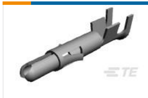
TE 产品编号350705-7 UMNL SPLIT PIN 20-14 AUBR L/P