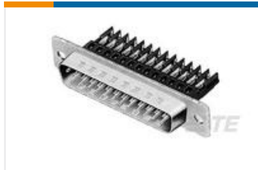
TE 产品编号1-745498-6 PLUG ASSY,37P,HDE,MS