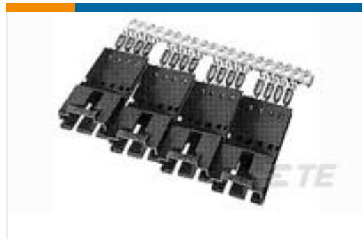
TE 产品编号5-103945-7 2X8 MTE SHRD PIN SR LATCH .100