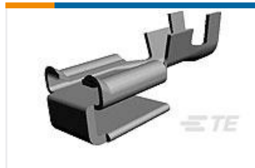
TE 产品编号62109-2 250 FASTON REC 18-14 AWG TPBR