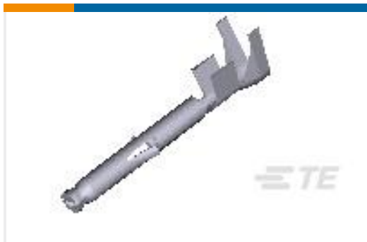
TE 产品编号1-770988-0 MINI UMNL SOK 22-18AWG AU