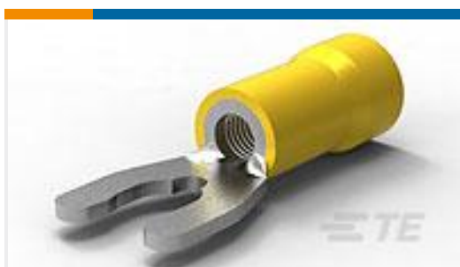
TE 产品编号52963-1 TERMINAL,PG SPR SPD 12-10 10