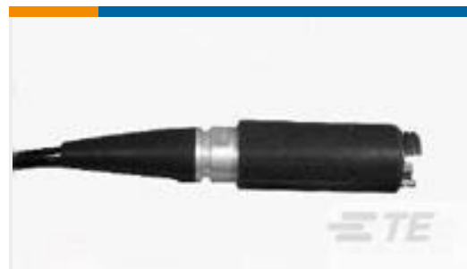
TE 产品编号 1828699-1 SHELL KIT, LP DH, PRO BEAM MINI, HA