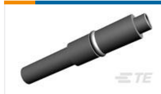
TE 产品编号 1754700-2 FERRULE KIT, SM, 126, MINI EB