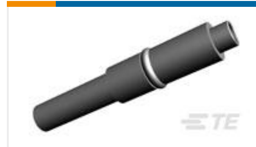
TE 产品编号 1754699-1 FERRULE KIT, MM, MINI EB