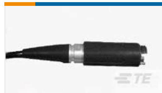
TE 产品编号 1918185-1 SHELL KIT SEAL BH PRO BEAM MINI HA