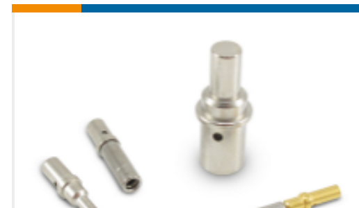
TE 产品编号 0460-202-16141 DEUTSCH Solid Contacts