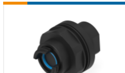
TE 产品编号 1985140-1 SHELL KIT, 1.8mm, HA, PRO BEAM MINI