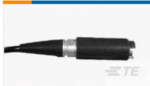
TE 产品编号 1828826-1 SHELL KIT, BLKH'D, SPL, PRO BEAM MINI