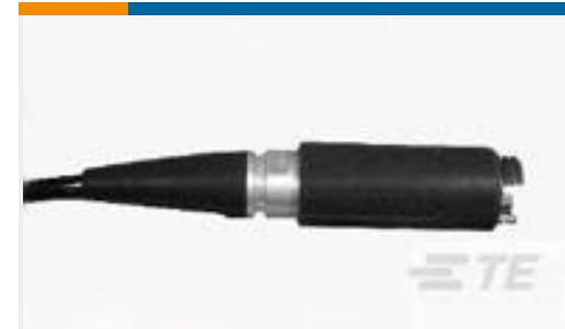
TE 产品编号 1828698-1 SHELL KIT, PRO BEAM MINI, PLUG, EPDM, AL