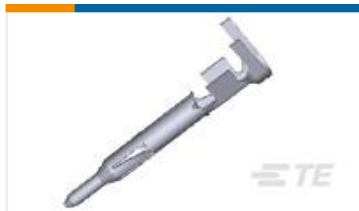
TE 产品编号170360-1 UNIV M-N-L PIN 22-18 AWG