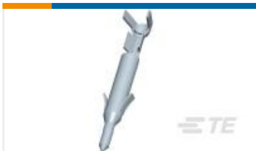
TE 产品编号170359-1 UNIV M-N-L PIN 26-22 AWG