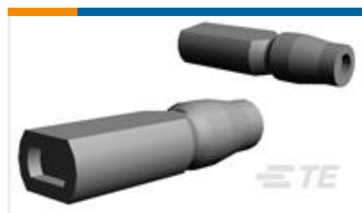
TE 产品编号170823-1 110 FASTON SLEEVE,TAB, TRANSPARENT,NAT