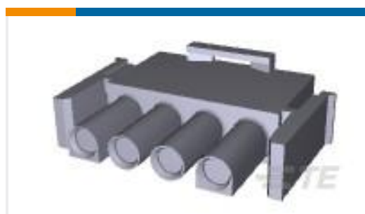
TE 产品编号350779-1 04P UMNL PLUG HSG