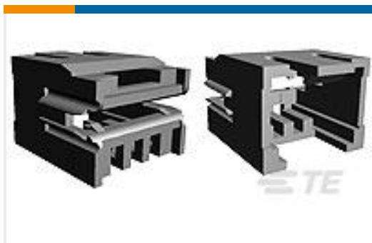
TE 产品编号1-964575-5 PCB RAHMEN 5P