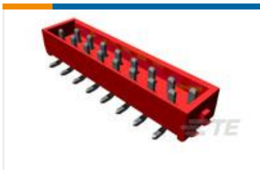
TE 产品编号8-338728-4 MICROM. MOB SMD CON