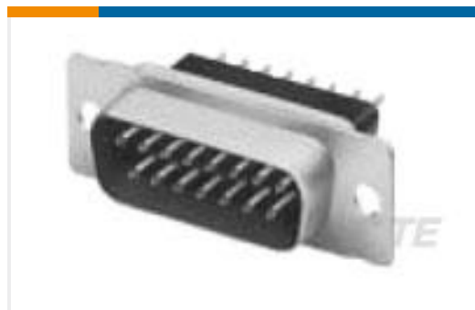
TE 产品编号205714-7 37 PLUG SP/MS STD