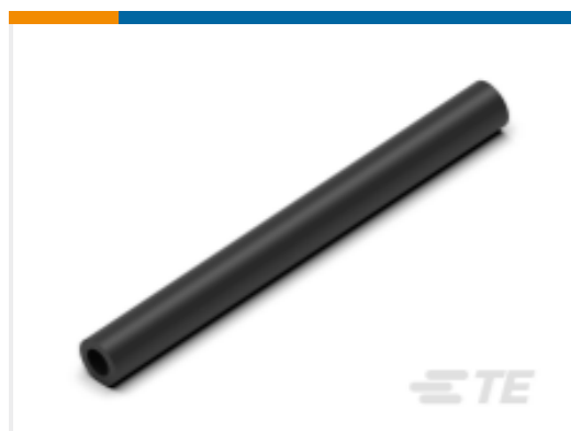
TE 产品编号D21910-000 EN-DCPT-3/1.5-45-SP