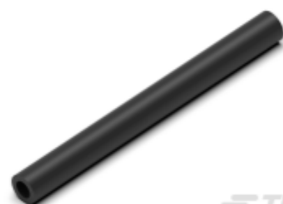
TE 产品编号 135919-1 CGPT 2/1 1.6/ 0.8 1m NOIR