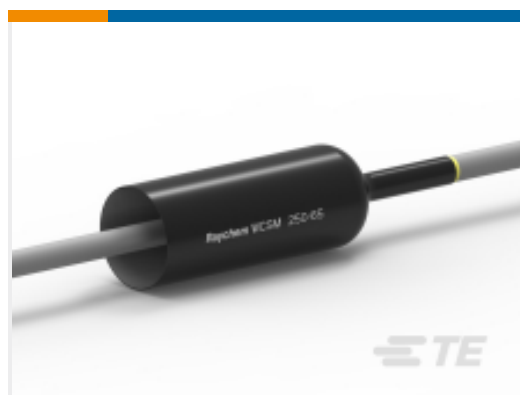
TE 产品编号CL1090-000 WCSM-250/65-1000/S(S)