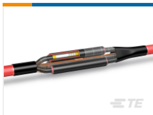
TE 产品编号634139-000 EPKJ-0910-(S5)