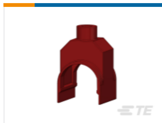
TE 产品编号CF9621-000 HEL-4836 SK(C500)