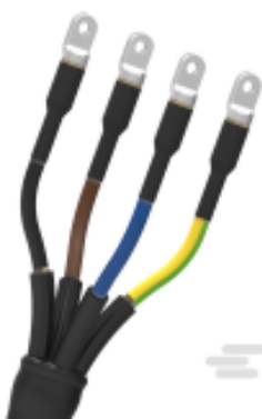
TE 产品编号 CAT-EPKT Heat Shrink Terminations up to 1 kV