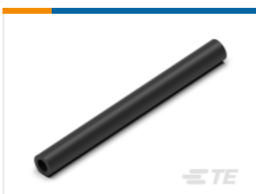
TE 产品编号E00758-000 EN-CGAT-3/1-0-SP