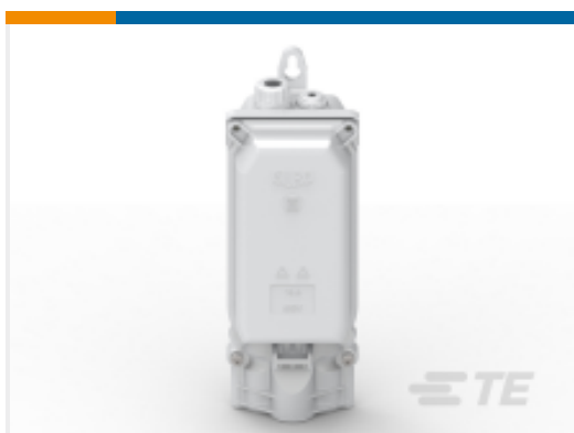
TE 产品编号619568-000 EKM-1281-1D2-5X16-2PG-C3