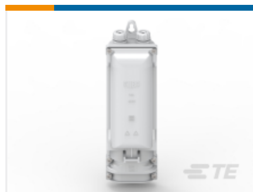
TE 产品编号592520-000 EKM-1282-4D1-5S-2PG-C2