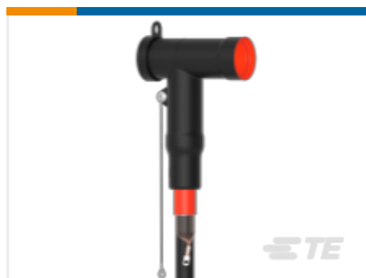
TE 产品编号CM0011-014 RSTI-5853