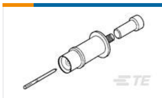
TE 产品编号225792-5 ARINC SIZE 3 SOCKET