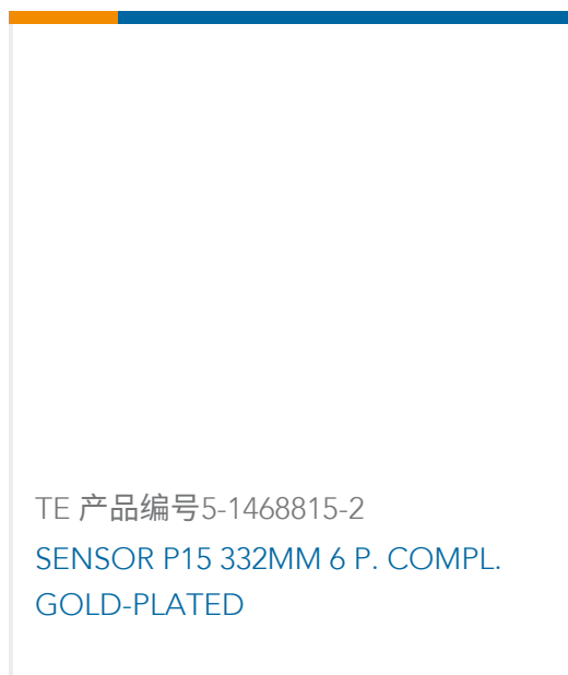
TE 产品编号5-1468815-2 SENSOR P15 332MM 6 P. COMPL. GOLD-PLATED