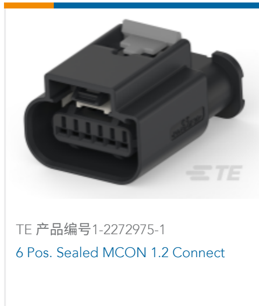
TE 产品编号1-2272975-1 6 Pos. Sealed MCON 1.2 Connect