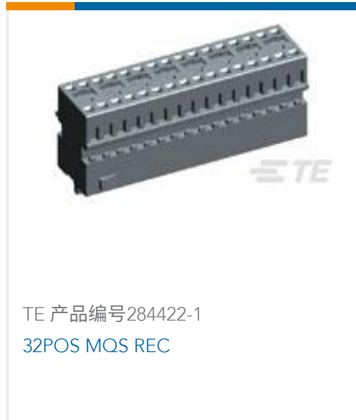
TE 产品编号284422-1 32POS MQS REC