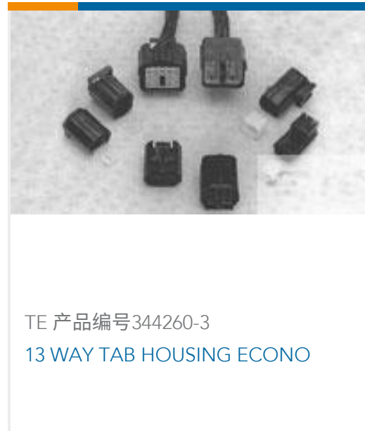
TE 产品编号344260-3 13 WAY TAB HOUSING ECONO