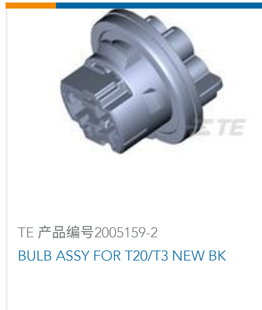
TE 产品编号2005159-2 BULB ASSY FOR T20/T3 NEW BK