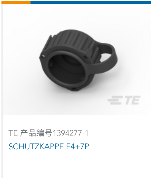
TE 产品编号1394277-1 SCHUTZKAPPE F4+7P