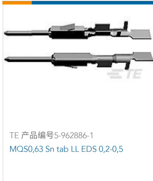
TE 产品编号5-962886-1 MQS0,63 Sn tab LL EDS 0,2-0,5