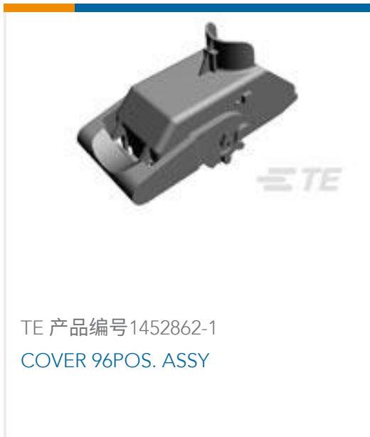
TE 产品编号1452862-1 COVER 96POS. ASSY