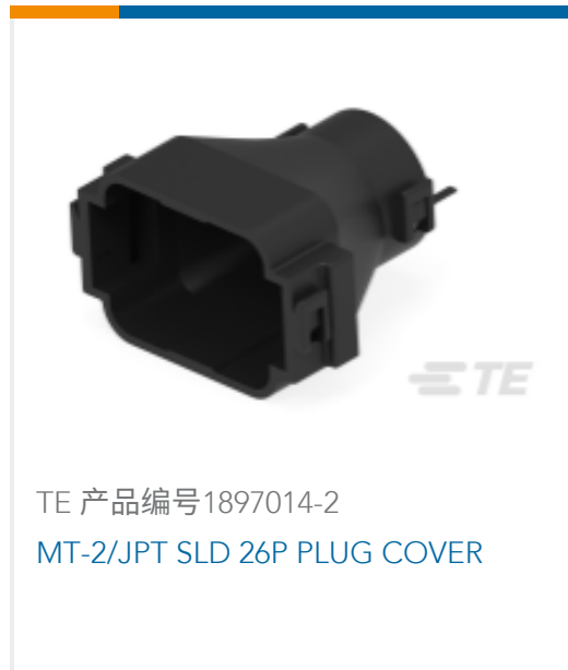
TE 产品编号1897014-2 MT-2/JPT SLD 26P PLUG COVER