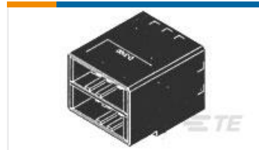
TE 产品编号1-2069436-2 D3200M H HDR ASSY 6POS LONG DISTANCE