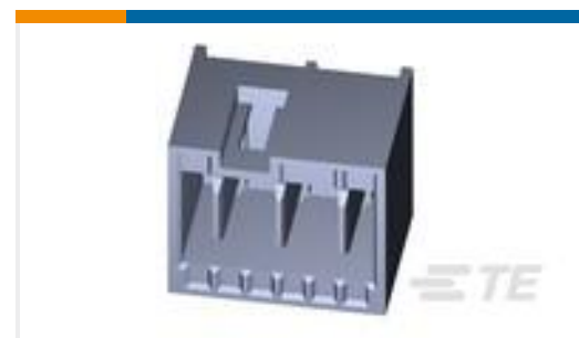
TE 产品编号9-2232043-3 3P, RAST 5 Tab Header, THV