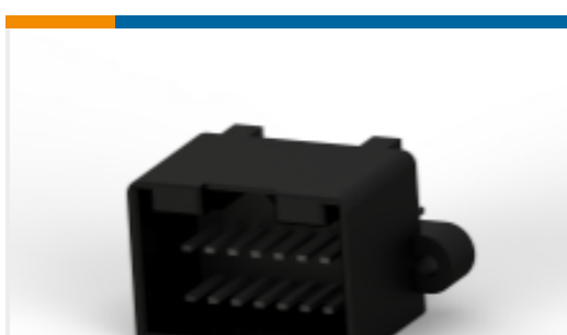
TE 产品编号174975-1 040 MLC 16POS CAP ASSY V TIN