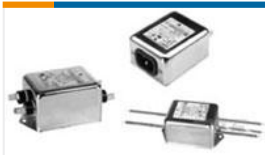
TE 产品编号6609035-8 6ESK7M=F7229 S0