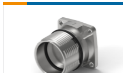
TE 产品编号AEA000N00000201000 623 RECEPTACLE, SPEEDTEC-READY