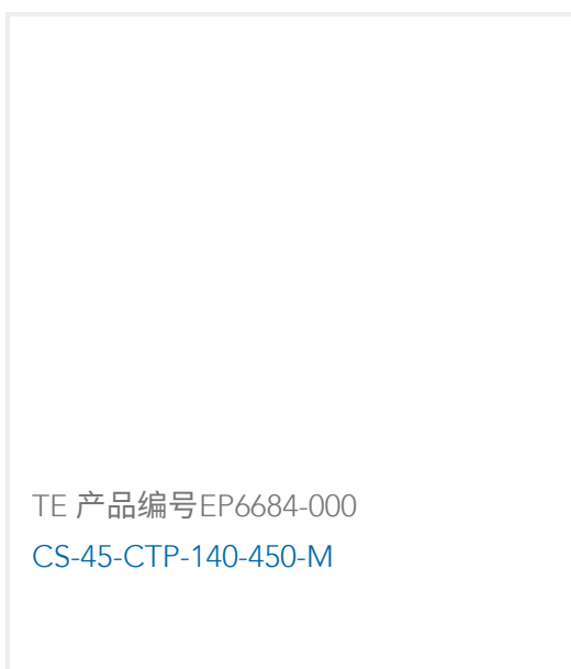
TE 产品编号EP6684-000 CS-45-CTP-140-450-M