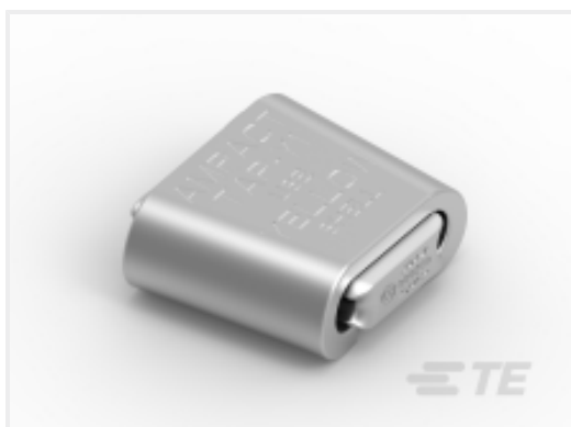
TE 产品编号1599502-4 AMPACT CONN ASSY, BLUE II SERIES