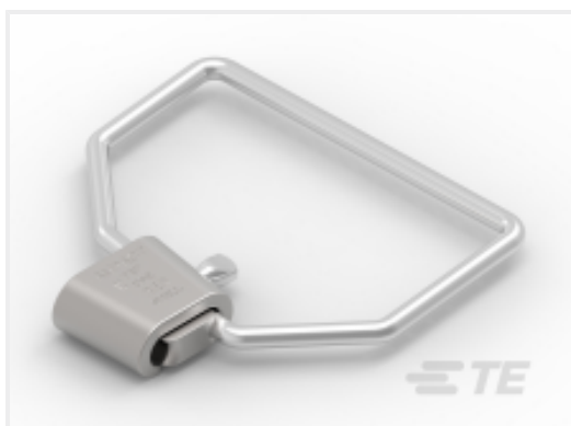
TE 产品编号626222-1 AMPACT STIRRUP ASSY