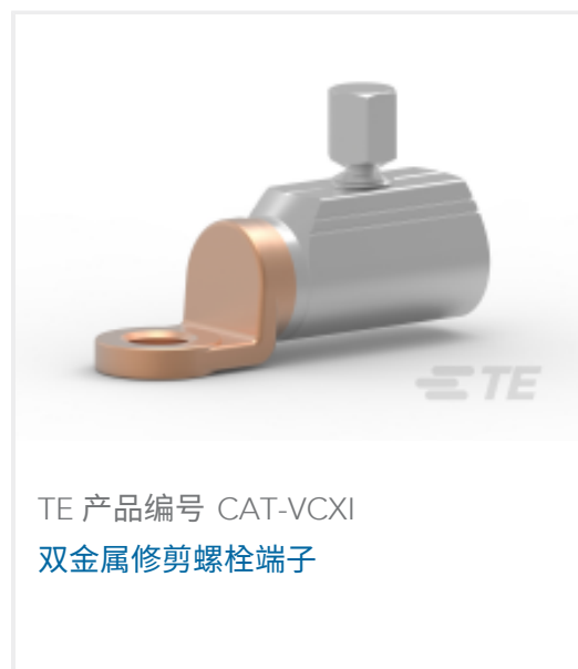
TE 产品编号 CAT-VCXI 双金属修剪螺栓端子