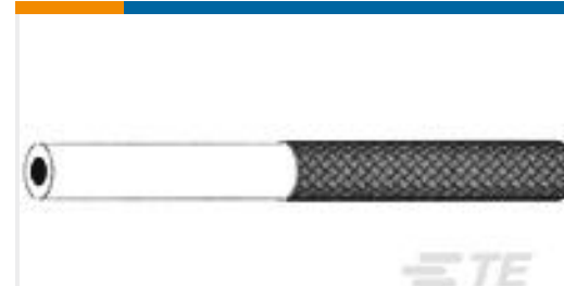
TE 产品编号1384453002 RAY-103-20.0(50)