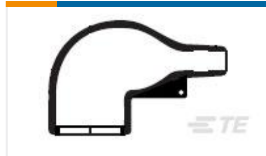
TE 产品编号878514-000 222K152-25-0