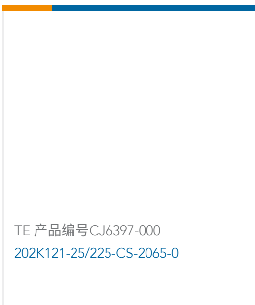
TE 产品编号CJ6397-000 202K121-25/225-CS-2065-0