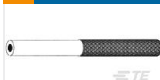
TE 产品编号CT99543001 RAY-103-30.0(50)