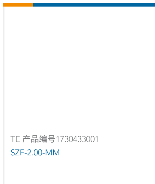
TE 产品编号1730433001 SZF-2.00-MM