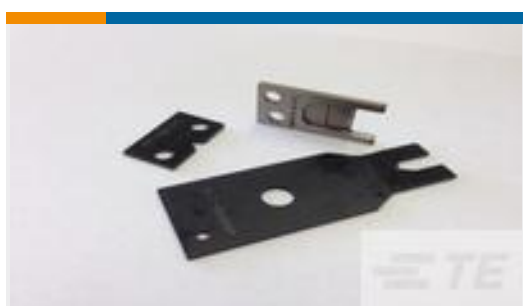
TE 产品编号7-240651-4 BLADE, SLUG