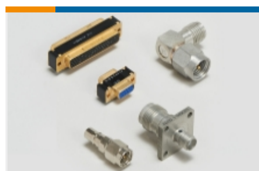
连接器适配器和连接器保护件(10)