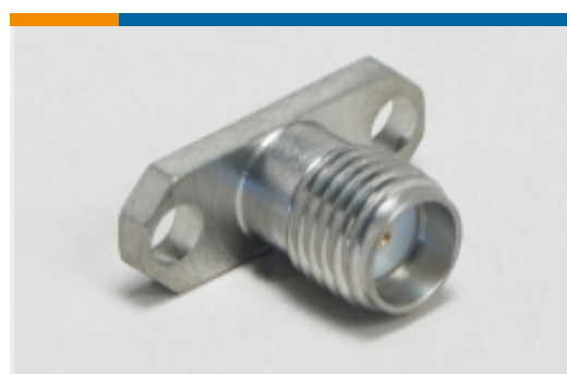
射频连接器发射器(6)