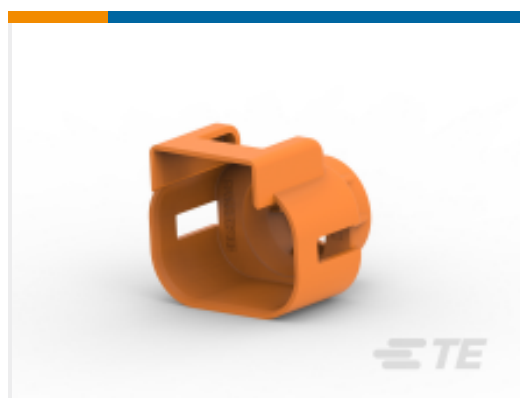
TE 产品编号2103013-3 CABLE SEAL RETAINER, SIZE 2, OR, HVA280