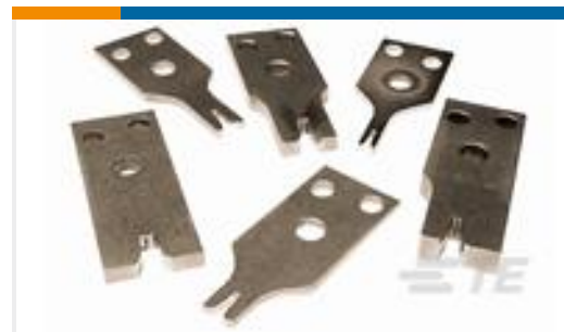
TE 产品编号1-1633961-2 CRIMPER, INSULATION F PREMIUM 25SQMM