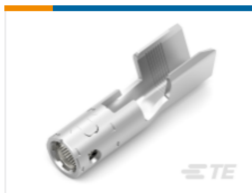
TE 产品编号2208669-3 8MM HV, CONTACT, ASSY