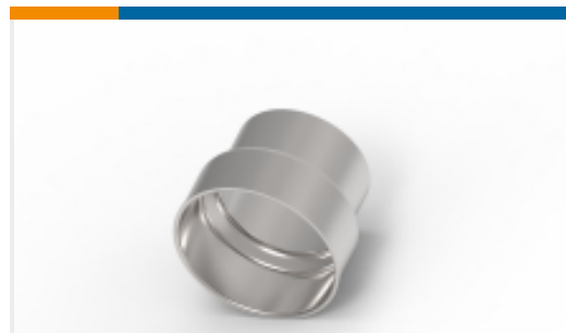
TE 产品编号2177090-3 STEEL, OUTER FERRULE, 8MM HV, 25SQMM