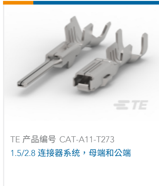
TE 产品编号 CAT-A11-T273 1.5/2.8 连接器系统，母端和公端