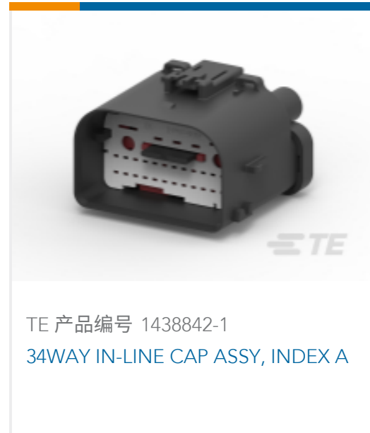
TE 产品编号 1438842-1 34WAY IN-LINE CAP ASSY, INDEX A