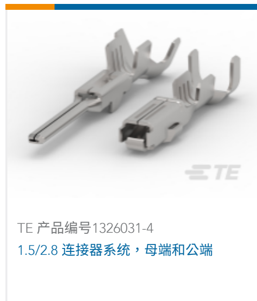
TE 产品编号1326031-4 1.5/2.8 连接器系统，母端和公端