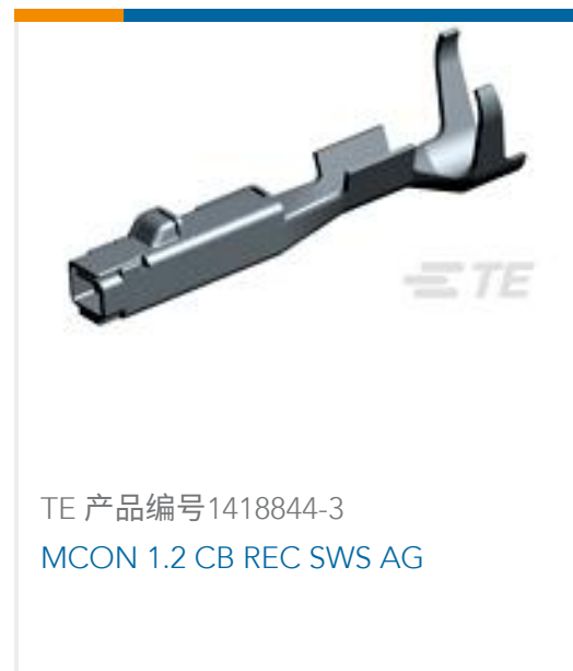
TE 产品编号1418844-3 MCON 1.2 CB REC SWS AG