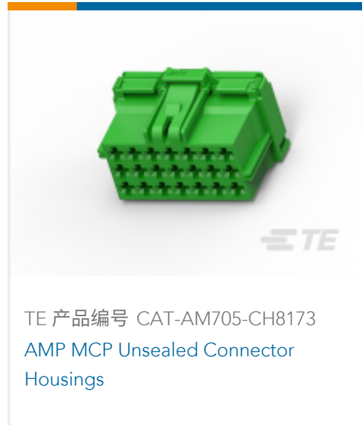
TE 产品编号 CAT-AM705-CH8173 AMP MCP Unsealed Connector Housings