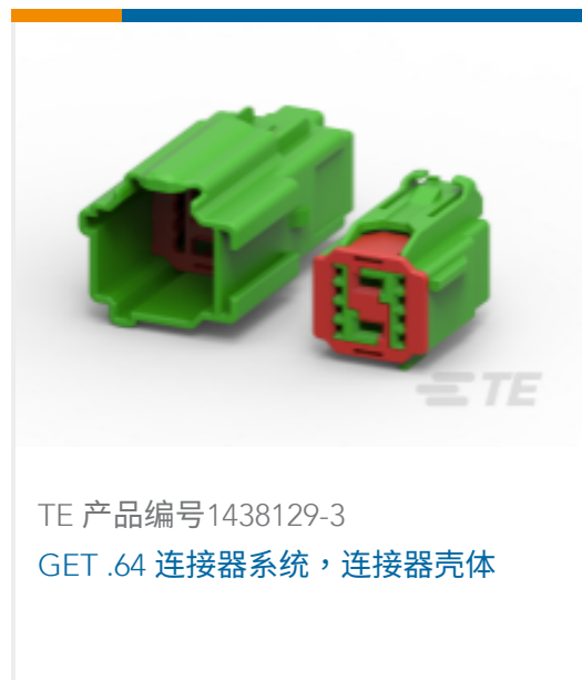
TE 产品编号1438129-3 GET .64 连接器系统，连接器壳体