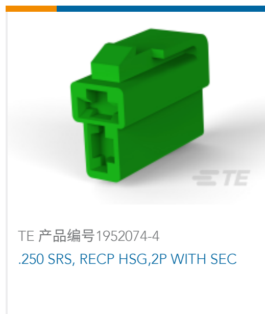
TE 产品编号1952074-4 .250 SRS, RECP HSG, 2P WITH SEC