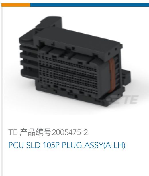
TE 产品编号2005475-2 PCU SLD 105P PLUG ASSY(A-LH)