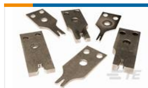
TE 产品编号3-1633738-2 CRIMPER, WIRE F .040