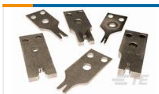
TE 产品编号1-1673600-0 CRIMPER, WIRE (.050" 'F')