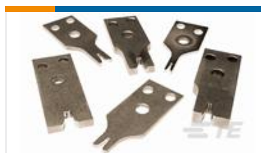
TE 产品编号3-456404-2 CRIMPER, WIRE .070 F