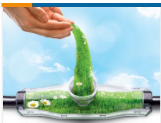
TE 产品编号EE3379-000 GUROFLEX-N-C170