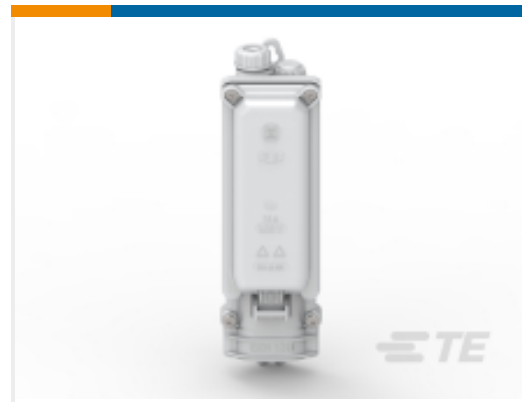
TE 产品编号968072-000 EKM-1261-2D1-5X16-DE01