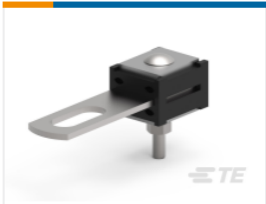
TE 产品编号707352-000 HEL-3909