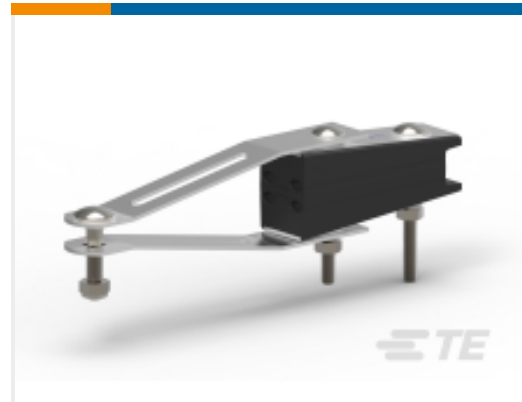
TE 产品编号2832095-2 PA4X50-95 (120) MA