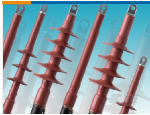
TE 产品编号492379-005 IXSU-F3314