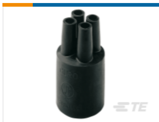
TE 产品编号678778-000 GURO-CBO-4X150S