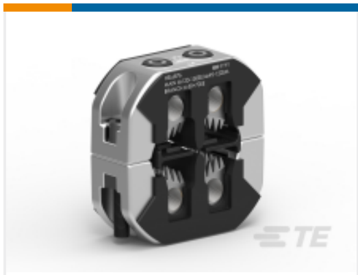
TE 产品编号F34646-000 HEL-6875-2X