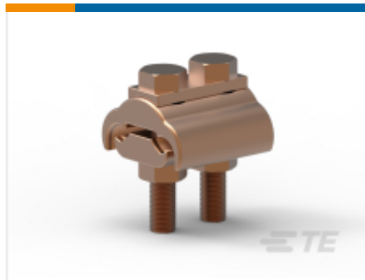
TE 产品编号165998-000 HEL-3029