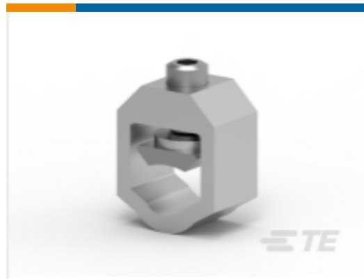
TE 产品编号388998-000 HEL-4712