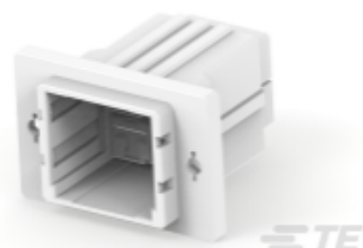
TE 产品编号 CAT-D9934-A83A Dynamic 5000 母端和公端壳体