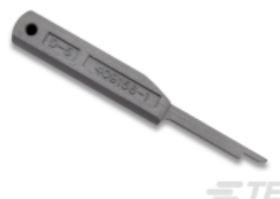
TE 产品编号 409158-1 EXTRACTION TOOL