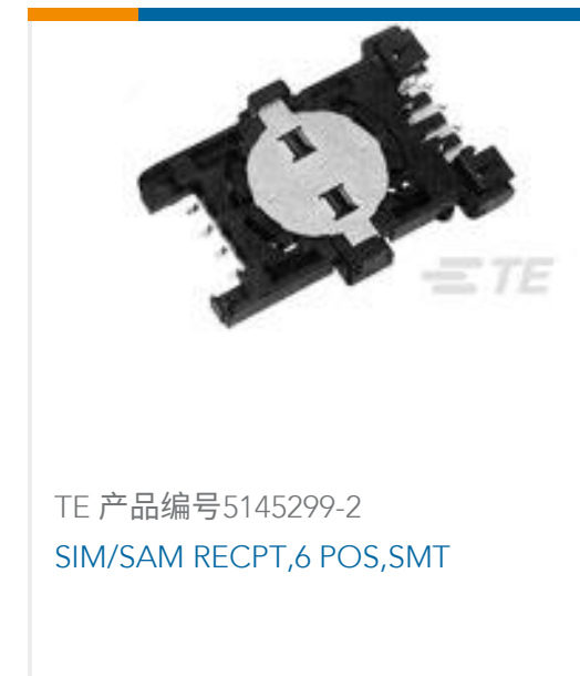
TE 产品编号5145299-2 SIM/SAM RECPT, 6 POS, SMT