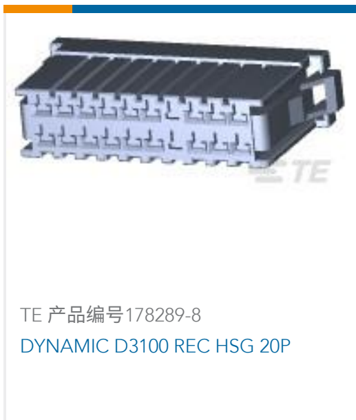
TE 产品编号178289-8 DYNAMIC D3100 REC HSG 20P