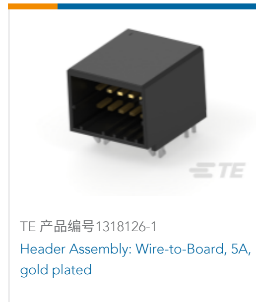
TE 产品编号1318126-1 Header Assembly: Wire-to-Board, 5A, gold plated