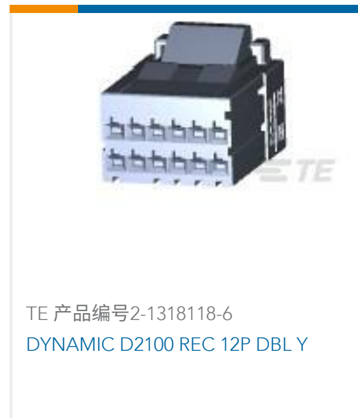
TE 产品编号2-1318118-6 DYNAMIC D2100 REC 12P DBL Y