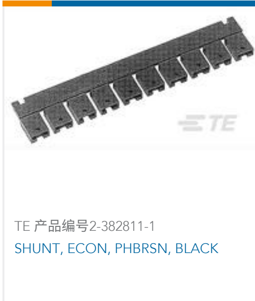
TE 产品编号2-382811-1 SHUNT, ECON, PHBRSN, BLACK