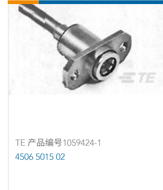
TE 产品编号1059424-1 4506 5015 02