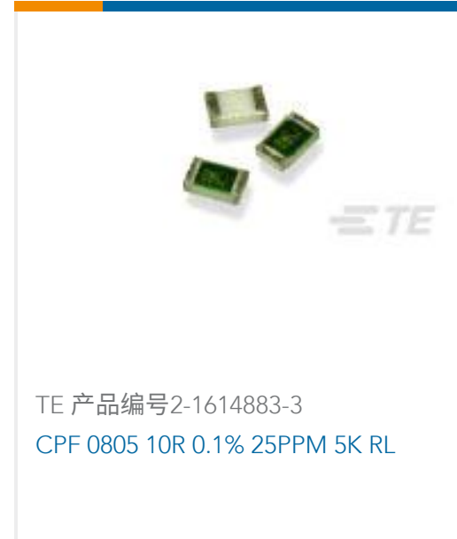
TE 产品编号2-1614883-3 CPF 0805 10R 0.1% 25PPM 5K RL