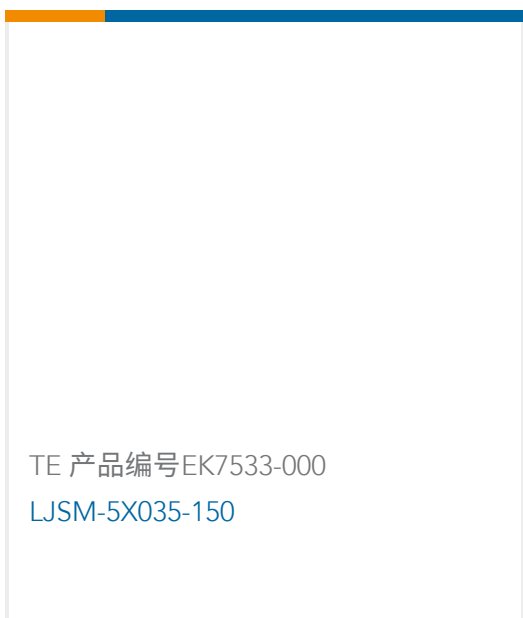
TE 产品编号EK7533-000 LJSM-5X035-150