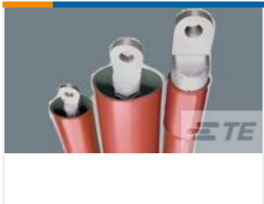
TE 产品编号572329-000 OXSU-F3141