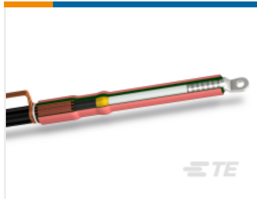
TE 产品编号086833-005 Heat Shrink Terminations: 1C/3C, Indoor