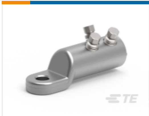
TE 产品编号2832179-1 BLMT-150/400 MK2-13