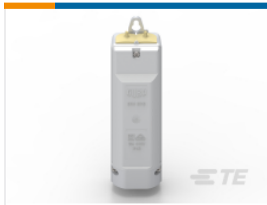
TE 产品编号D56795-000 EKM-2042SK-2D1-6-E42