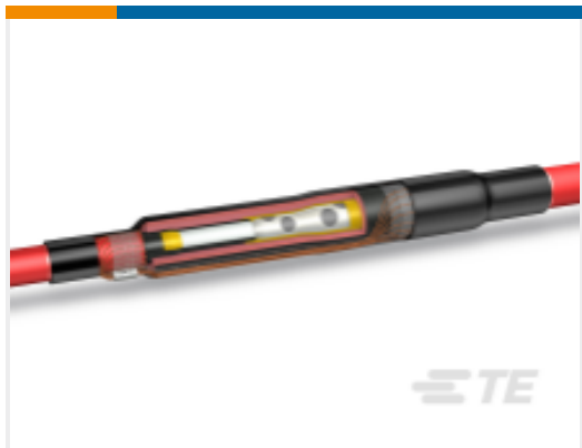
TE 产品编号CN1151-005 MXSU-3151-T6