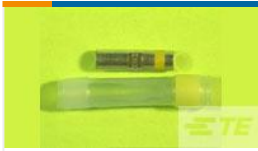
TE 产品编号650083-000 D-436-59