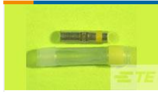
TE 产品编号650110-000 D-436-0128