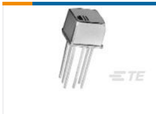
TE 产品编号3-1617146-4 JMGACDG-12LW = M39016/18-052L