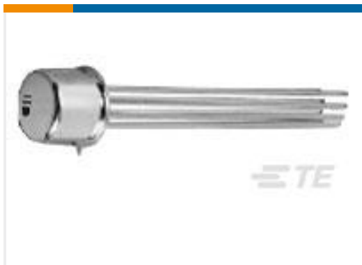
TE 产品编号3-1617162-3 J1MSWT-5XP = M28776/4-017P