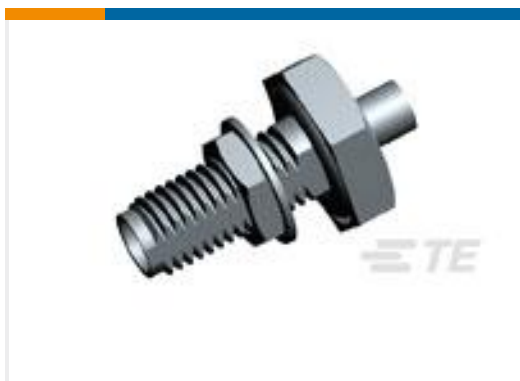
TE 产品编号1045398-1 SSMA Bulkhead Cable Jack 1004 5005 90