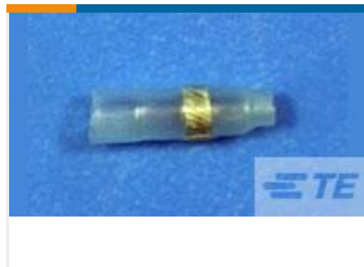
TE 产品编号CY0665-000 D-141-30CS3070