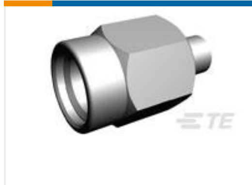
TE 产品编号1045358-1 SSMA Cable Plug 1001 5045 92