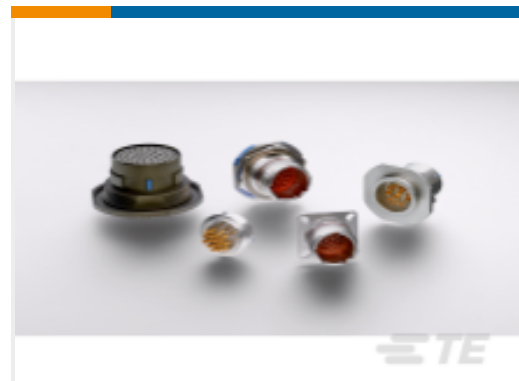
TE 产品编号YDTS24Y15-05PNV001 HERM RECP