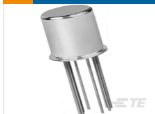
TE 产品编号1617119-2 J1MAW-12XP = M39016/7-019P