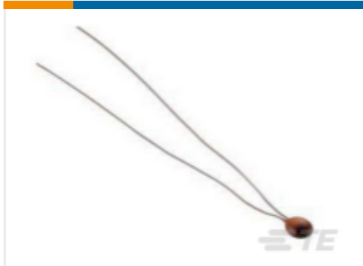
TE 产品编号SP44908X-19 44908X GSFC 311P18-08A7R6