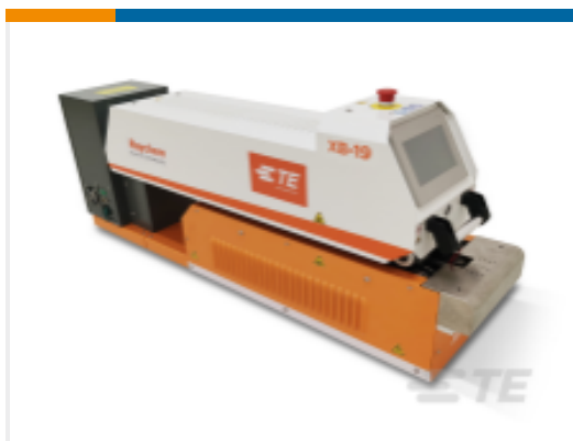
TE 产品编号 2375320-2 XB19 Belt Heater, 150mm (6") Version