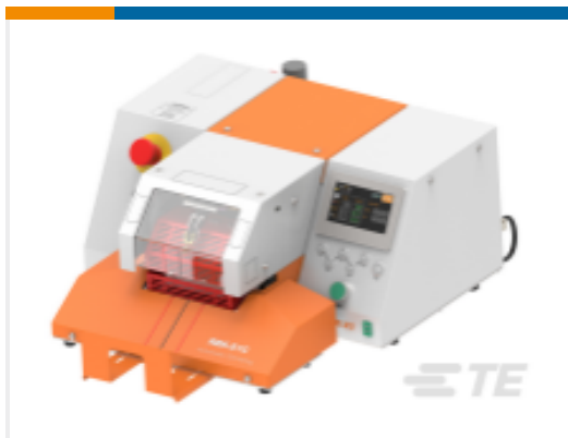
TE 产品编号 1-2376800-3 RBK-X1C, W/ AIR COOLING