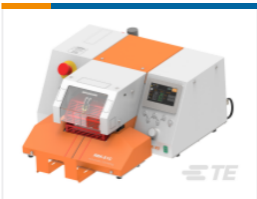
TE 产品编号 1-2376800-4 RBK-X1C CE, W/ AIR COOLING