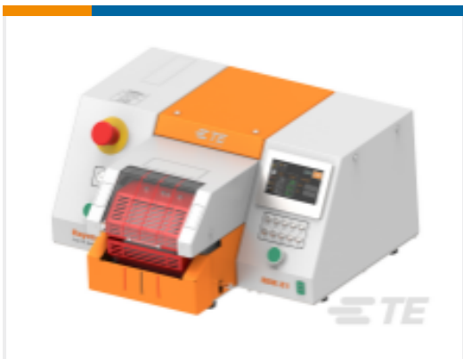
TE 产品编号 1-2234800-1 RBK-X1, AUTO TRIGGER