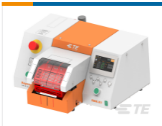
TE 产品编号 1-2234800-3 RBK-X1, W/ AIR COOLING