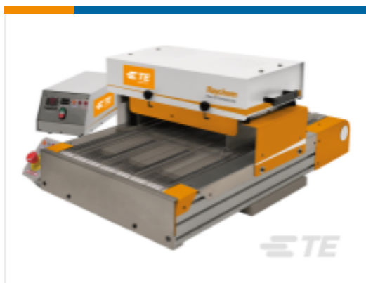
TE 产品编号 2326489-1 MODEL 105 TUNNEL OVEN, 36" ENTRY, STANDA