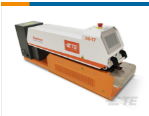
TE 产品编号 2375310-1 XB17 Belt Heater, 220V