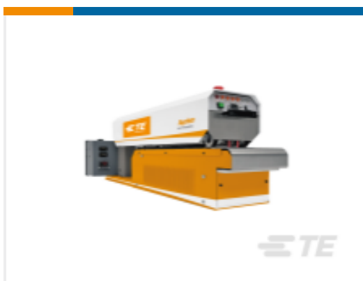
TE 产品编号 714529-000 CLTEQ-M19-BELT-HTR