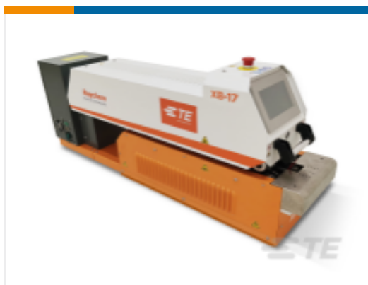
TE 产品编号 2375310-2 XB17 Belt Heater, 110V