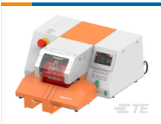
TE 产品编号 2376800-1 RBK-X1C STD