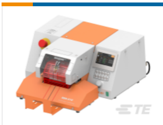
TE 产品编号 2376800-2 RBK-X1C CE STD