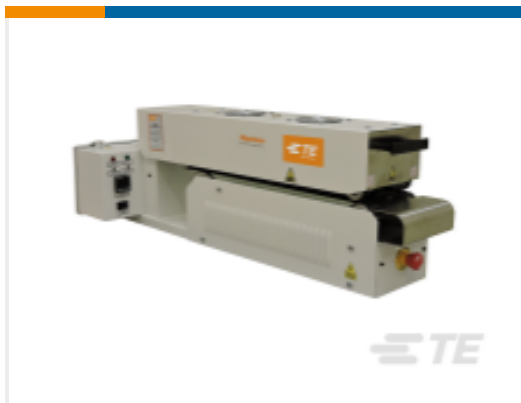
TE 产品编号 2280355-1 220 V MODEL 17