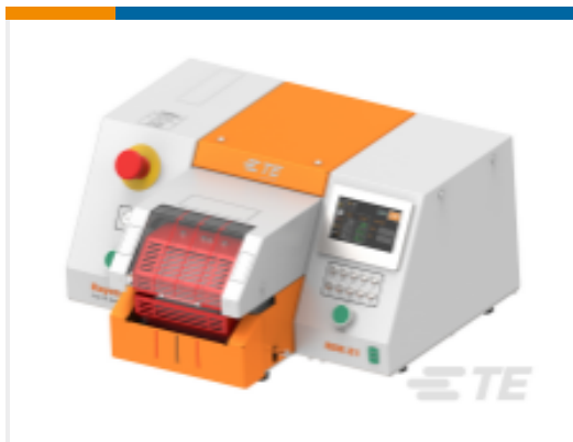
TE 产品编号 2234800-1 RBK-X1 STD