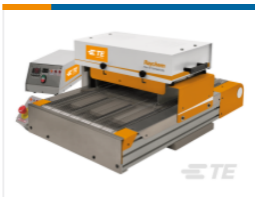
TE 产品编号 2326489-1 MODEL 105 TUNNEL OVEN, 36" ENTRY, STAND A