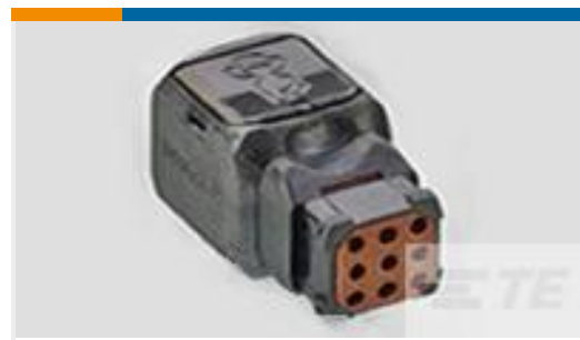
TE 产品编号D369-P99-NS0 369 9 WAY PLUG, NO CONTACTS, SKT