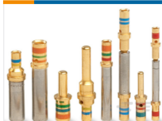
TE 产品编号ZPF0000000000003590 724-0001-12