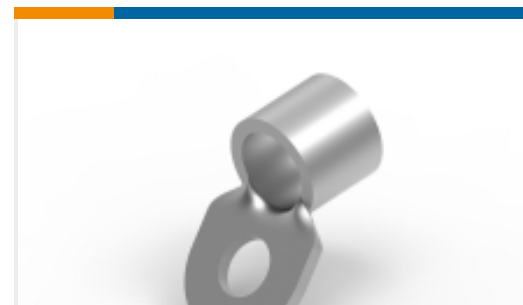
TE 产品编号136061-1 TERMINAL SOLISTRAND 2/0 BENT 135 DEG