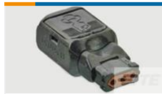
TE 产品编号D369-P33-NS0 369 3 WAY PLUG, NO CONTACTS, SKT