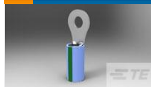
TE 产品编号134122-1 TERM, PIDG, R, IR, 14, M5