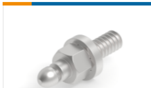
TE 产品编号1-2308265-5 QL SET FOR VARIANT B 5