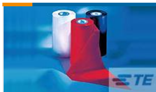
TE 产品编号310109-000 TMS-101-RIBBON-4RPSCE