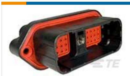
TE 产品编号DRC22-40PA 40P RECP ASM