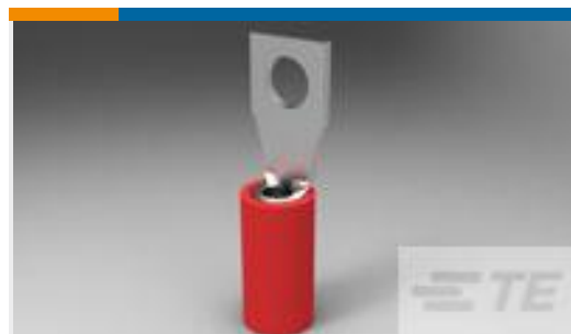
TE 产品编号33476 PIDG RECT 22-16COMM 22-18MIL 6