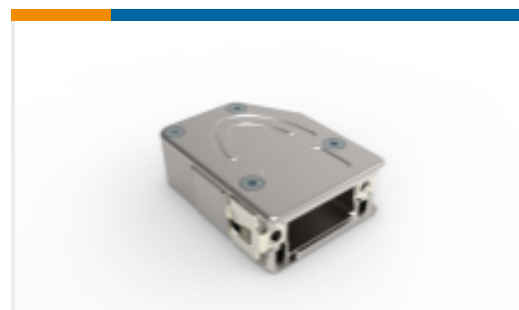
TE 产品编号1-2308319-1 FULL METAL HOODS SIZE 1 (1)