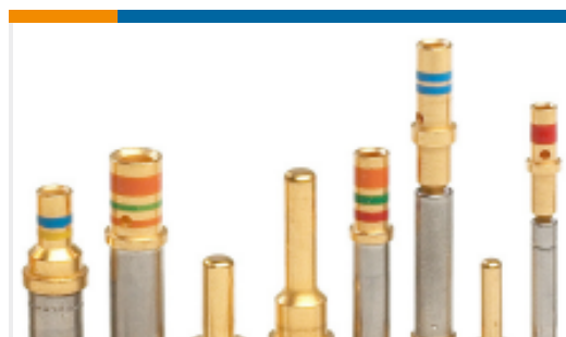
TE 产品编号0641-3-1231L CONT PIN