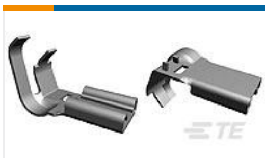
TE 产品编号180429-2 250 FASTON,FLAG,REC.,17-14 AWG, TPBR