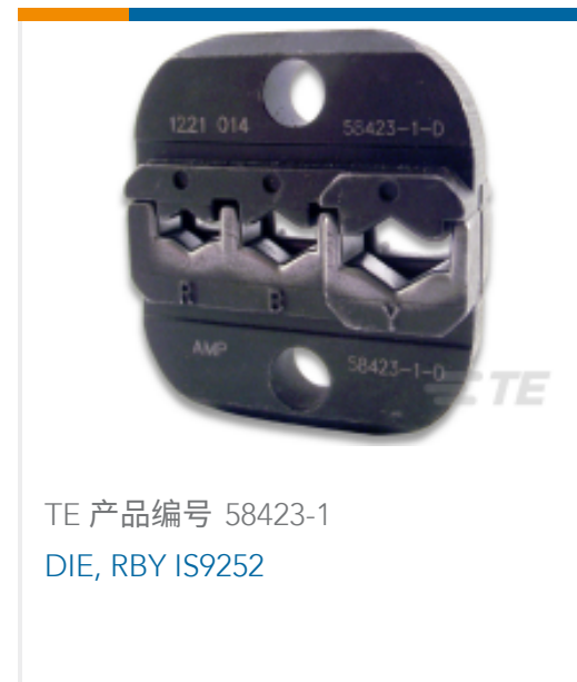
TE 产品编号 58423-1 DIE, RBY IS9252