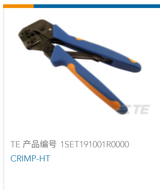
TE 产品编号 1SET191001R0000 CRIMP-HT