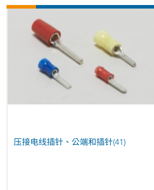
压接电线插针、公端和插针(41)