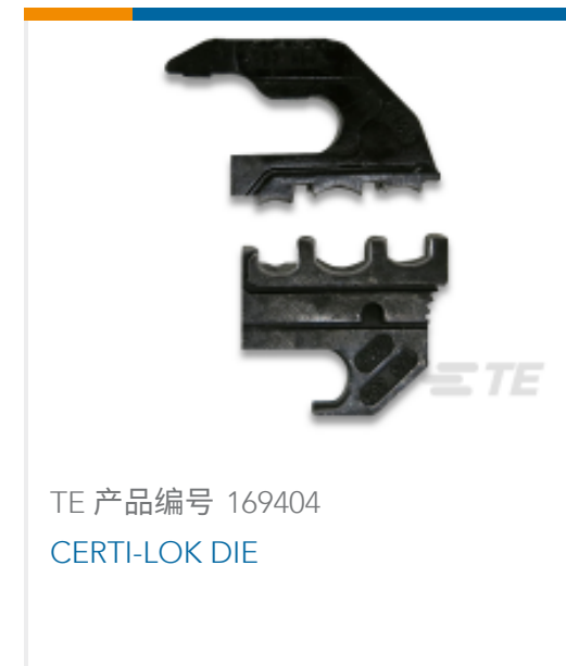
TE 产品编号 169404 CERTI-LOK DIE