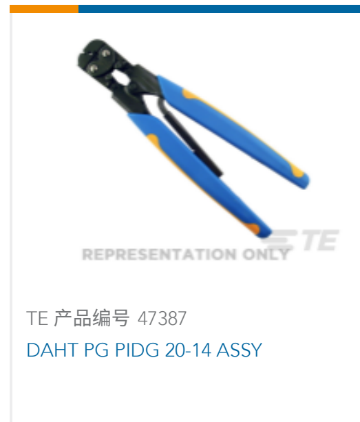
TE 产品编号 47387 DAHT PG PIDG 20-14 ASSY