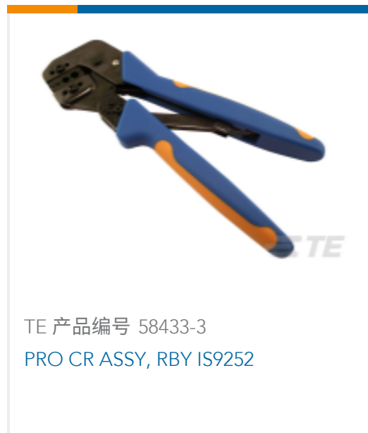
TE 产品编号 58433-3 PRO CR ASSY, RBY IS9252