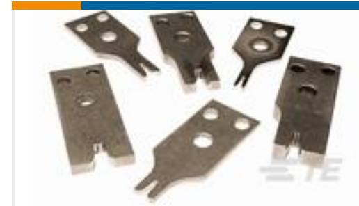
TE 产品编号453819-3 CRIMPER, WIRE-.062 WIDE F