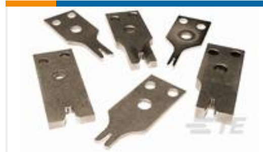
TE 产品编号1-913714-3 CRIMPER, INS