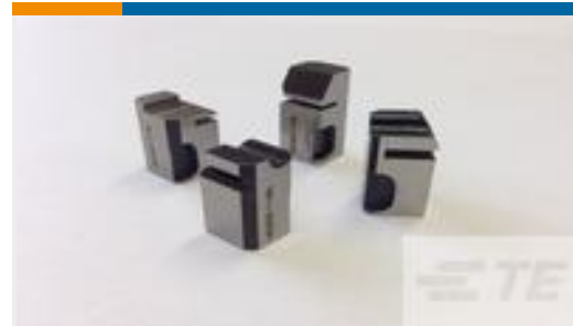
TE 产品编号724919-1 SHEAR, FLOAT, FRONT