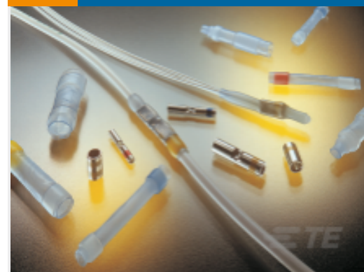
TE 产品编号650084N003 D-436-60CS940