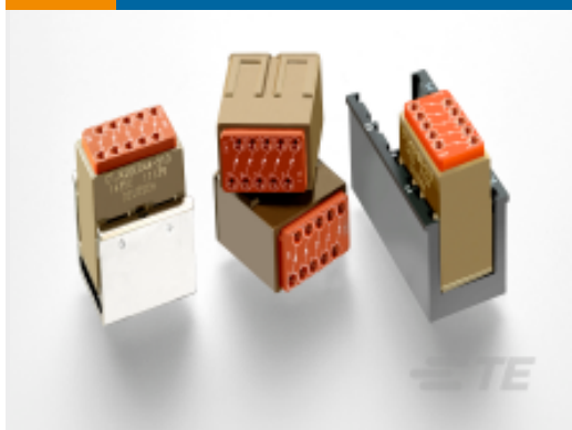
TE 产品编号CTJ420E184-513 ELEC MODULE