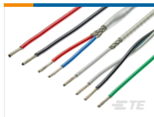
TE 产品编号2611473001 44A0111-12-54