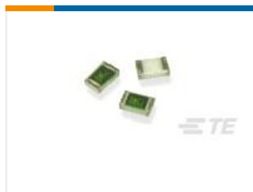
TE 产品编号6-1879127-7 RN 0402 422R 0.1% 10PPM CUT LENGTH