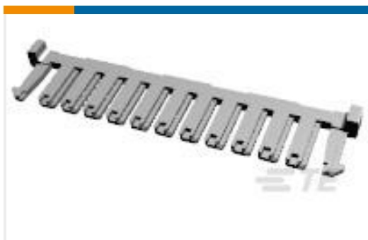
TE 产品编号917709-1 2.5 SIGNAL D/LOCK D.L.P 13P