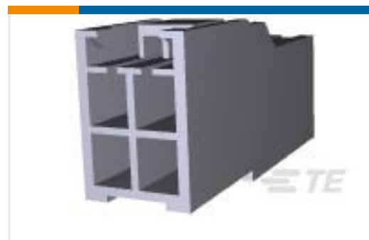
TE 产品编号176284-9 AMP UNIVERSAL POWER CAP 4P