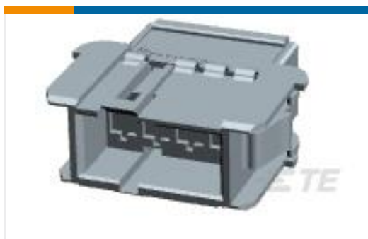
TE 产品编号9-927742-4 4POS FASTIN FASTON HOUSING