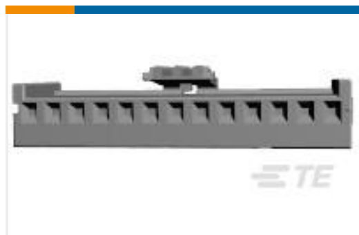
TE 产品编号917697-1 2.5 SIGNAL D/LOCK PLUG HSG 13P