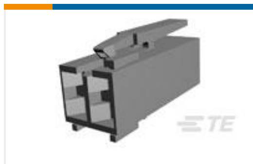
TE 产品编号7-1241961-2 STD TIM HOUSING MKII 2POS