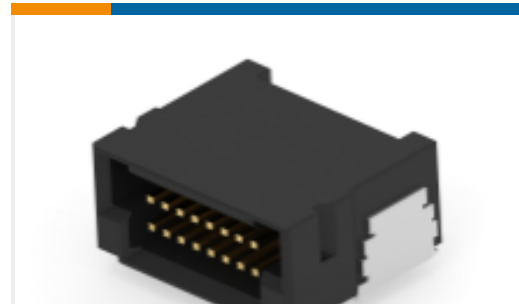
TE 产品编号294283-E DRCB 0,80 16 M SMD * 137 E009 196 GURT *