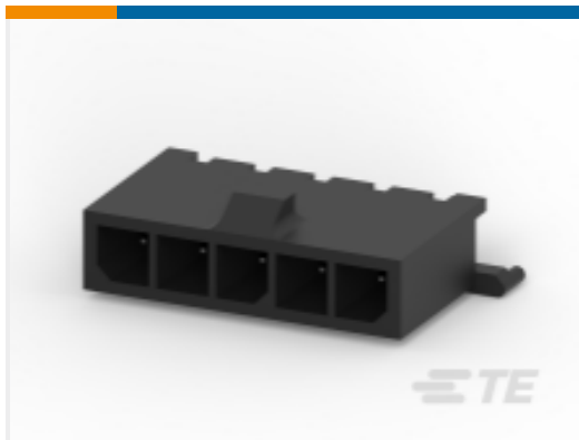
TE 产品编号4-1445050-0 MICRO MNL HDR ASSY S/ROW LF