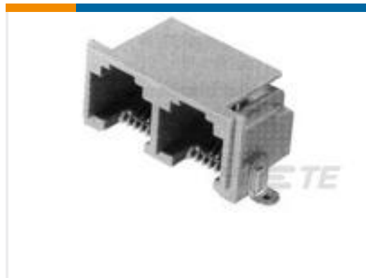
TE 产品编号5406903-4 MJ,RJ11,SMT,1X2,6/6,GRAY,22*RL