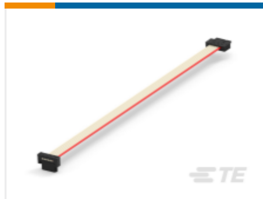
TE 产品编号839686-E IDCCS SRC 1,27 6 * SFX APU 160 PVC