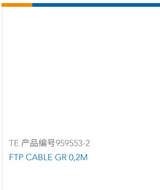
TE 产品编号959553-2 FTP CABLE GR 0,2M