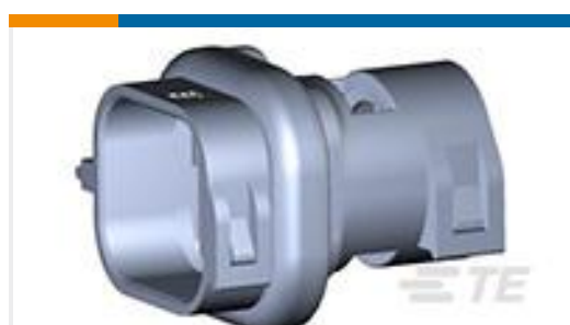
TE 产品编号1801155-5 COVER FOR 2W HP CONNECTOR