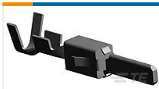
TE 产品编号2-964302-2 TAB A 2.8x0.8 CONTACT CF SWS Ag