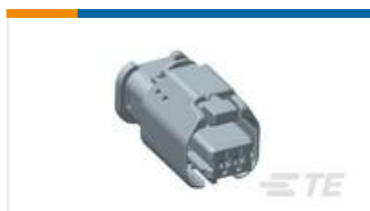
TE 产品编号1-1801175-6 2W RECEPTACLE HP CONNECTOR BROWN