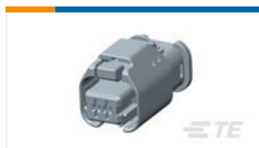
TE 产品编号1-1801175-7 2W RECEPTACLE HP CONNECTOR WHITE