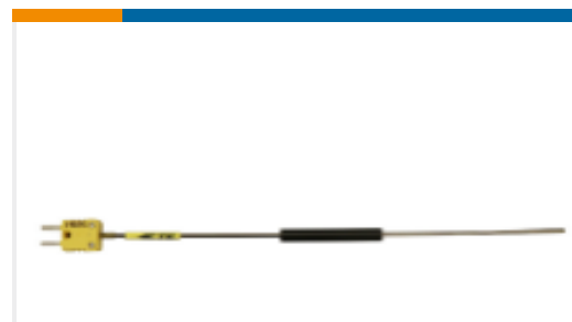
TE 产品编号288869-000 CLTEQ-UHI-250A-1-PRB