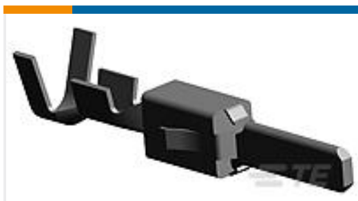
TE 产品编号2-964300-2 TAB A 2.8x0.8 CONTACT CF SWS Ag