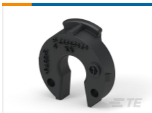
TE 产品编号9-2334942-1 HD MATEnet COVER FOR SWS, GRP D