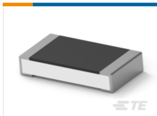
TE 产品编号2-2176387-2 RQ 1206 221K 0.1% 10PPM 1K RL