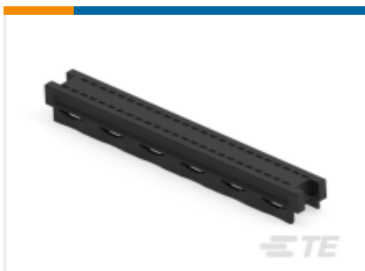
TE 产品编号244633-E SMCEZT FLKF 7-01 50POL IDC FLACHBANDKABE