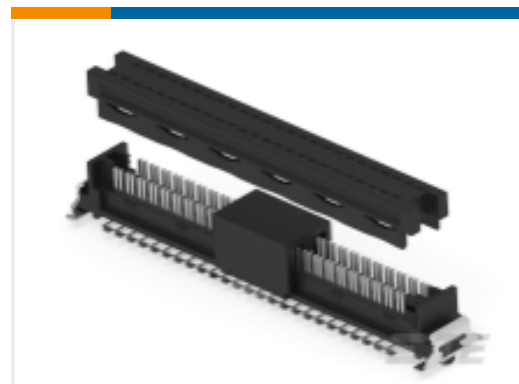
TE 产品编号244630-E SMCIDC 50 KV AB VV 7-01 CL * H007 717 PO