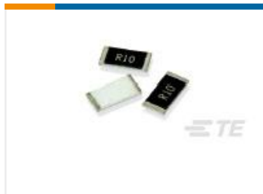
TE 产品编号2-1879462-4 RL73H 2B R15 1% 1K RL