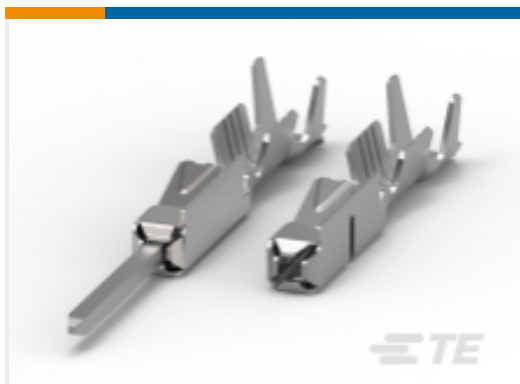
TE 产品编号968075-2 MQS,母端和公端