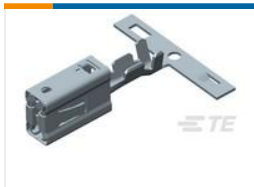
TE 产品编号1-2208459-3 AMP MCP 6.3/4.8K,TERMINAL,FUSE 0.64