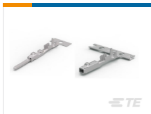
TE 产品编号1718760-1 MCON Receptacle and Tab