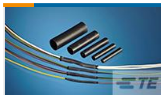
TE 产品编号CH02996001 QSZH-125-NR3-65MM