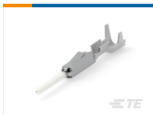
TE 产品编号5-962886-3 MQS0,63 Ag tab LL EDS 0,2-0,5