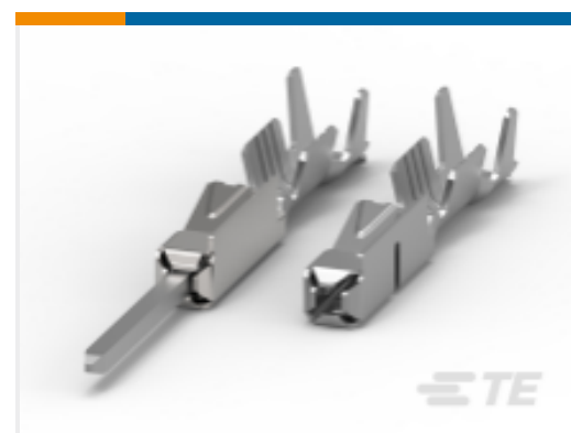
TE 产品编号968678-2 MQS, 母端和公端